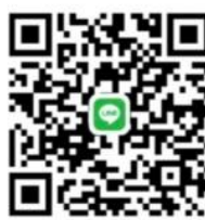
กลุ่มไลน์ Police ITA ภ.จว.ร้อยเอ็ด