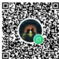
กลุ่มไลน์ POLICE ITA ภ.๔

หมายเหตุ: ให้ข้าราชการตำรวจตามผนวก ก - จ เข้ากลุ่มไลน์ POLICE ITA ดำรวจภูธรภาค ๔ และ Police ITA ภ.จว.ร้อยเอ็ด ให้เรียบร้อย (ภายใน ๒๖ ธ.ค.๒๕๖๖)